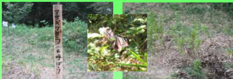
(10.31にアサギマダラを確認)