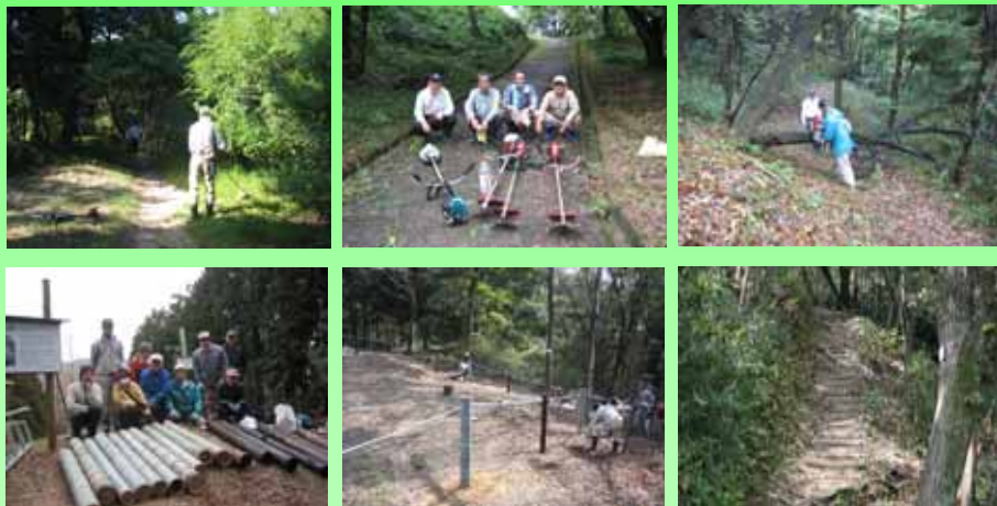
2014年 徳山桜の根を守るため、従来の囲い柵よりも広い囲い柵を竹と木の杭を使って新たに設置しました。

(草刈は毎年継続して行なう必要がある大事な作業です。これを怠ると遊歩道や植生の維持管理が損なわれてしまいます)